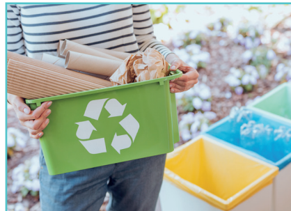
Bacs de tri