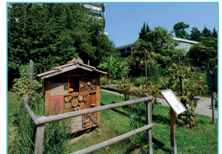
Hôtels à insectes

Grand Est ALSACE CHAMPAGNE-ARDENNE LORRAINE